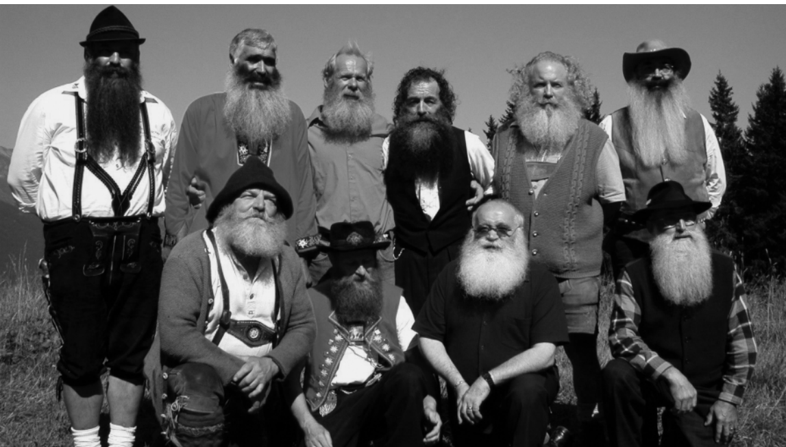
Die Top-Ten-Bärte, die 2003 in Brambrüesch die Mitkonkurrenten austachen.

Anmeldungen an Chur Tourismus, Grabenstrasse 5, 7002 Chur, Tel 081 252 18 18 oder per Mail: info@churtourismus.ch. Nachmeldungen sind bis 12.00 Uhr auch vor Ort noch möglich.