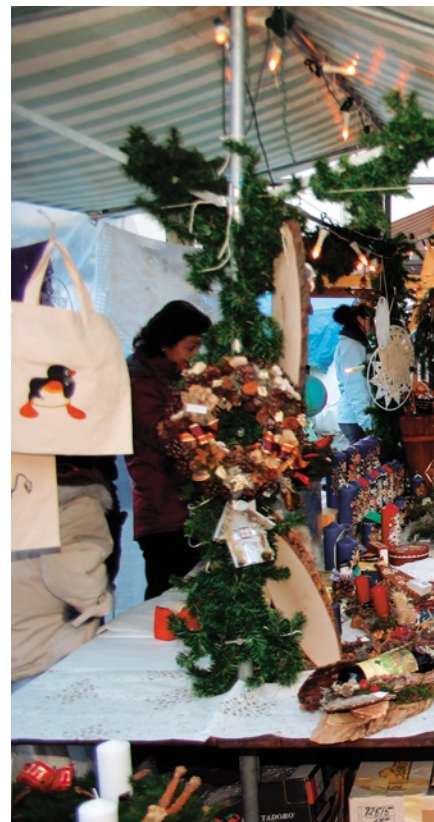
Gilt als der Grösste und Angebotsreichste:

Endgültig eingeläutet wird die festliche Einkaufszeit in Chur mit dem Weihnachtsmarkt am 24. und 25. November. Mit rund 120 Anbietern im Gebiet Obere Gasse, Ochsenplatz, Untere Gasse, Kornplatz und Martinsplatz gilt er als grösster Weihnachtsmarkt der Schweiz. Die Vereinigung Churer Altstadt als Organisatorin hält auch in diesem Jahr am traditionellen Konzept fest. So stehen ausschliesslich kunsthandwerkliche Advents- und Weihnachtsprodukte aus der Region im Marktange-