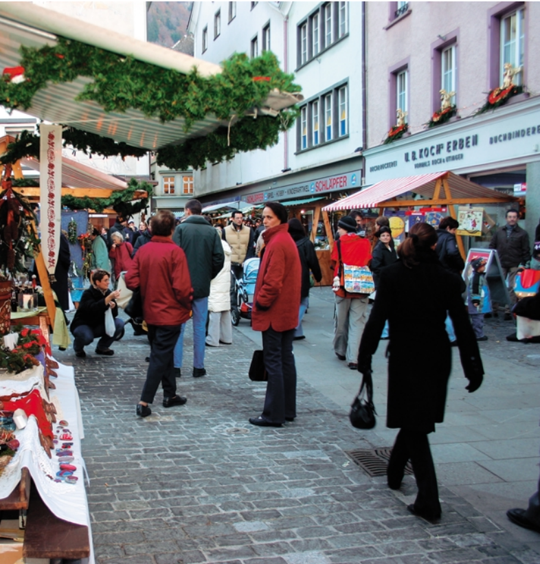
der Churer Weihnachtsmarkt am 24. und 25. November.

nisiert wird diese Aktion von der Fachgruppe «Soziale Aufgaben» des Katholischen Frauenbundes Graubünden, die damit etwas Gutes für die Benachteiligten unserer Gesellschaft tun möchten. Die Enthüllung des Engels findet am Freitag (25. November) um 19 Uhr statt. Umrahmt wird die schlichte Feier von Gesangseinlagen eines Kinderchors, den Besucherinnen und Besuchern wird ein kleiner Apéro gereicht.