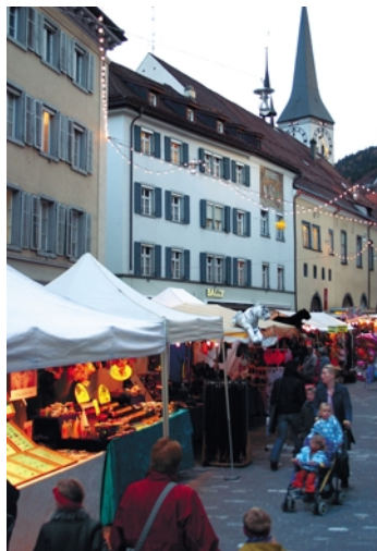
Bringt ein Sammelsurium an Artikeln, aber auch weihnächtliche Düfte in die Poststrasse: der Andreasmarkt am 18. und 19. November.

Die Blätter fallen, der Herbst ist in voller Blüte, die Vorboten der Weihnachtszeit halten Einzug in die Stadt. Unübersehbare Zeichen dafür sind nicht nur der Geruch gebratener Marroni über dem Bahnhof- und Postplatz oder die ersten auf Bescherung getrimmten Schaufensterauslagen.