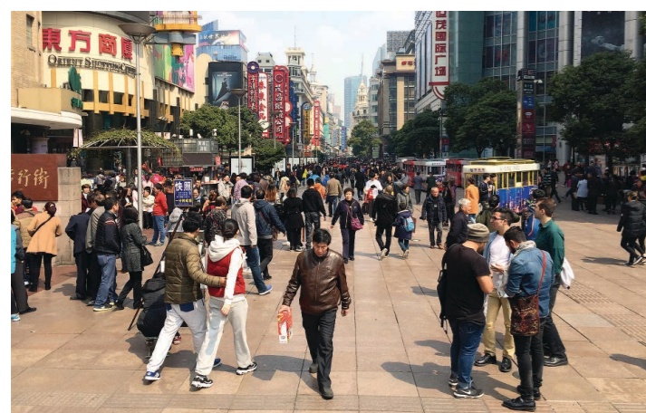
Beliebte Shoppingmeile: Die Nanjing Road ist das Einkaufsparadies Nummer eins in ganz China.

der durch einen solchen Chat zustande kam, erzählt sie mit leuchtenden Augen. «Wir waren 15 gestylte Frauen und tanzten in einem der höchsten Türme Shanghais in einer Bar. Mit Ausblick auf die beleuchtete Grossstadt. Ein unglaubliches Erlebnis.» Ob sie Heimweh haben? «Die Kinder und ich ja. Ich vermisse unsere Leute. Und die gute Luft.» Was schlechte Luft bedeutet, konnte sich die Familie vor der Abreise gar nicht vorstellen. «Der Himmel ist hier an schlechten Tagen grau, und die Menschen laufen mit Mundschutz herum», erklärt sie. Trotzdem: Den Entscheid für das China-Abenteuer bereut sie nicht. «Ich empfehle es jedem, eine solche Chance zu nutzen.» An ihrem neuen Wohnort treffen die Parpans auf viele Gleichgesinnte. Menschen, die ebenfalls den Mut hatten, etwas zu wagen. Und auch wenn nicht immer alles auf Anhieb funktioniert, sind sie sich einig: Es ist ein unglaublich wertvoller Lebensabschnitt, auf den sie sich da eingelassen haben. ■