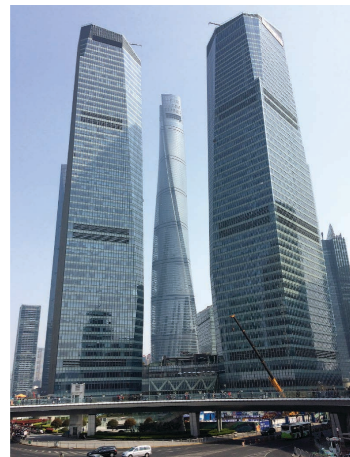
Imposante Wolkenkratzer: Der Shanghai Tower (Mitte) ist mit 632 Metern das zweithöchste Gebäude der Welt.