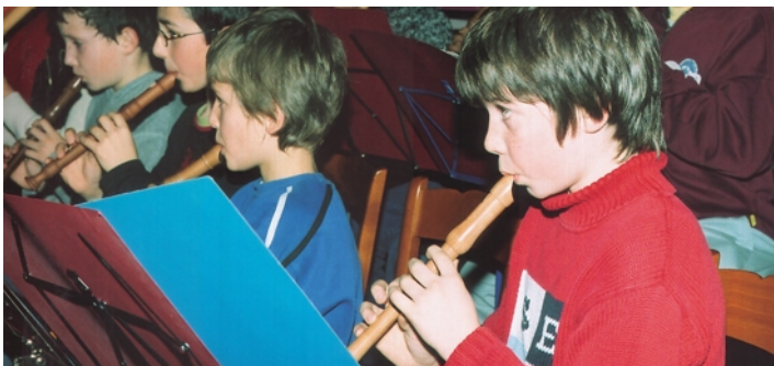
Die Blockflötenabteilung der Singschule feiert den 30. Geburtstag.

Die Singschule Chur bietet nebst dem Singunterricht in Klassen, dem Chorsingen und Einzelsingen seit 30 Jahren auch Blockflötenunterricht an. Während dieser Zeit wurden rund 3000 Kinder im Blockflötenspiel unterrichtet.