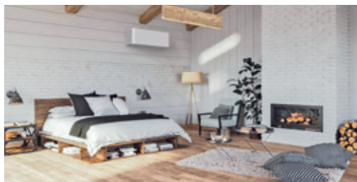
Der Daiseikai (o.) und der Shorai Curve von Toshiba.

Aktuelle Design-Klimaanlagen von TOSHIBA zeigen, wie sich Komfort und Architektur verbinden lassen. Der neue Shorai Curve überzeugt mit klaren Linien, matter Oberfläche und einer ruhigen Formensprache. Der Haoiri setzt mit seinem textilen Frontcover bewusst gestalterische Akzente und wirkt beinahe wie ein Möbelstück. Beim Daiseikai steht neben hoher Energieeffizienz auch die Materialität im