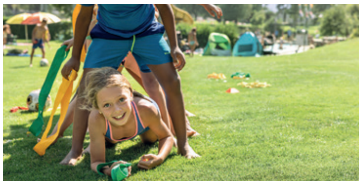
Erlebnismachmittage im Freibad Obere Au.