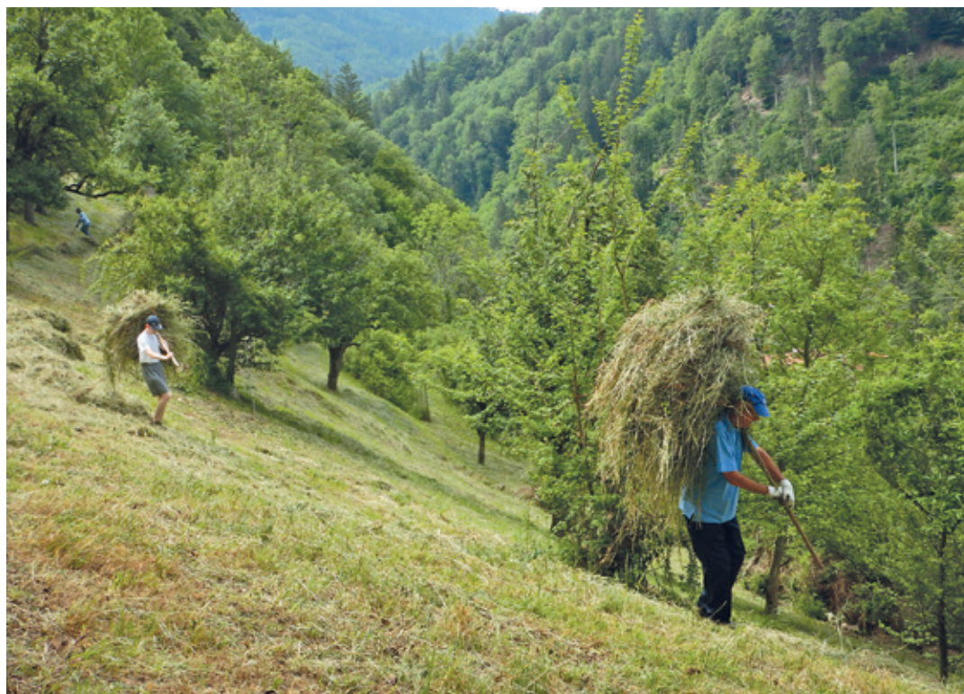
Im Seidengut wird einmal im Jahr gemäht.

hin gepflegt. Seit letztem Jahr auch unter der Woche, immer wieder gibt es Donnerstagabend-Einsätze, bei denen sich Freiwillige nach dem Büroalltag noch sinnvoll in der Natur auspowern können.