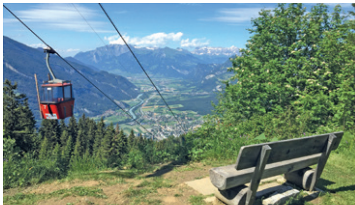
Bergerlebnisse für Gross und klein.

Die Sommerferien sind die perfekte Gelegenheit, um die Natur zu entdecken und gemeinsam unvergessliche Momente zu erleben. Auf dem Churer Hausberg Brambrüesch warten abwechslungsreiche Erlebnisse für die ganze Familie.