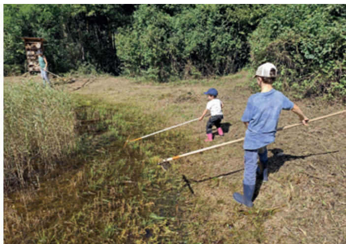
Alle Generationen arbeiten jeweils zusammen, hier bei den Teichen auf dem Rossboden.

40 Abfallsäcke voller Neophyten in einem Jahr aus dem Seidengut geholt», erzählt Panzer. Dank dieser Aktionen habe man die Neophyten im Seidengut mittlerweile gut im Griff. Das ist sehr wichtig, denn die gebietsfremden Pflanzen verdrängen sonst die einheimischen Gewächse. «Mit vielen Händen kann man viel bewirken», führt Panzer den Gedanken des WWF zu diesen Freiwilligeneinsätzen aus. Und betont, dass Neophyten mittlerweile so oft anzutreffen sind, dass man sich bei der Bekämpfung der Eindringlinge auf wertvolle Flächen beschränke. Denn ganz Herr werden könne man diesen wohl nicht mehr. Bei den ersten Einsätzen im 2017 hatte Panzer übrigens noch keinen einzigen Neophyten hier angetroffen, das ist ein Problem der Neuzeit. Bis letztes Jahr fanden solche Freiwilligen-Einsätze ausschliesslich an den Wochenenden statt. Oft kamen dabei äl-