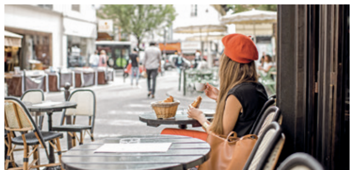
Mit Sprachkenntnissen klappt alles leichter in den Ferien.

wie diese Begriffe richtig geschrieben und souverän ausgesprochen werden. Und noch viel mehr. Sie trainieren Alltagssitua-