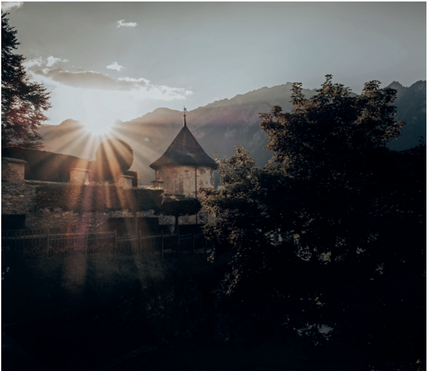
Die Kammerphilharmonie wird mit zwei ganz besonderen Konzertprogrammen an insgesamt acht Aufführungen im Schloss Haldenstein zu hören sein.

John Williams' legendäre Filmmusik zu Star Wars hat ein klares Vorbild: Die grossbesetzte Suite «The Planets» von Gustav Holst. Beispielsweise finden sich im «Imperial March» und dem