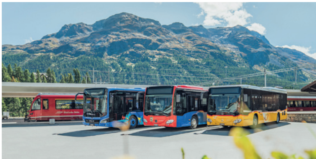
Mit der BÜGA Sommer-Aktion im Juli den ÖV in ganz Graubünden zum halben Preis erleben.