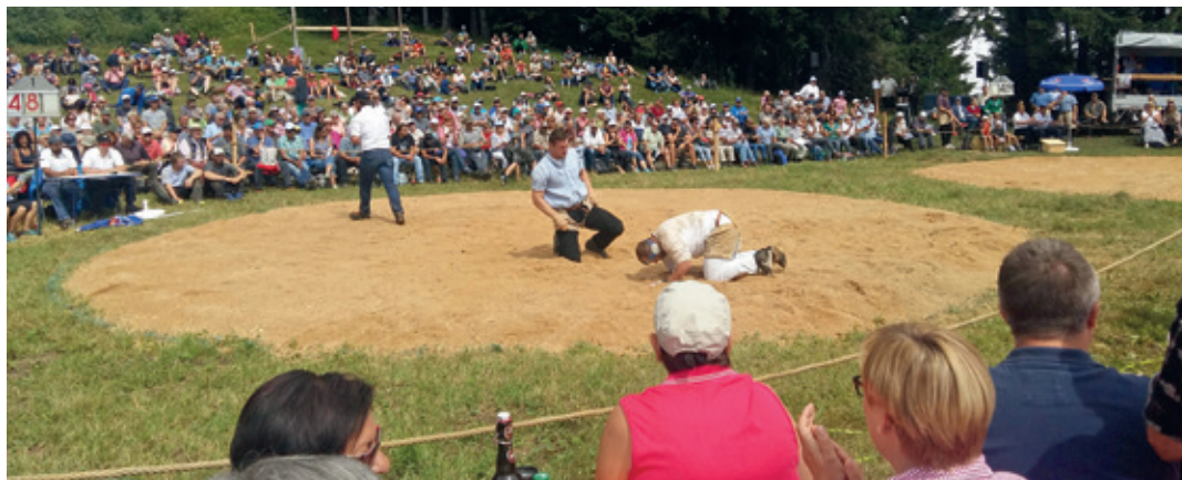
Die hoffentlich wieder zahlreich aufmarschierenden Zuschauer werden spannenden Schwingsport erleben.