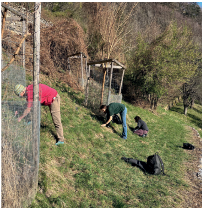
Freiwillige pflegen gemeinsam wertvolle Flächen in Chur.

Mittlerweile ist das Seidengut mit wertvollen Magerwiesen überzogen, eine hohe Pflanzenvielfalt zeigt sich hier. Noch immer stehen zudem viele alte Obstbäume im Seidengut, Apfel- und Birnbäume vor allem. Auch die Trockenmauern wurden vor einigen Jahren restauriert. Dank der Entbuschung und Rodung mit den Freiwilligen ist die ursprüngliche Wiese wieder erblüht, und nun wird sie weiter-